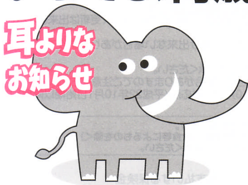
新キャラクター「ぞう」君です。